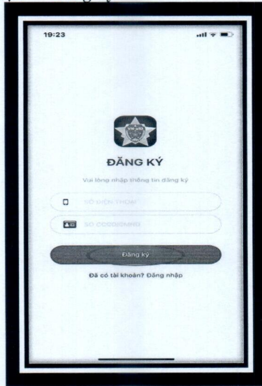
Đăng ký tài khoản VNEID

Tại cửa sổ Đăng ký hãy nhập Số điện thoại và Số căn cước công dân/Chứng minh thư nhân dân của bạn → Đăng ký .